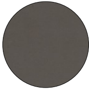
WARM GREY ARPA FENIX 0718